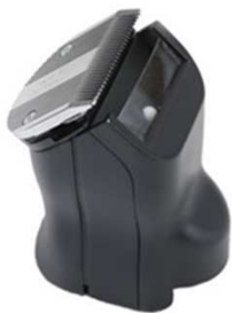
専用器具『ヘアークリッパー』

専用の器具『ヘアークリッパー』を使用して、最速最短（最短3分）のカット施術を行います。 髪の毛が落ちない仕組みになっていますので、カット施術後のシャンプーが不要ですし、ハサミと違って安全ですので、利用者の方のご負担を軽減すると共に、他の施術メニューをご利用頂ける時間を確保し、より楽しんで頂ける環境を作っています。